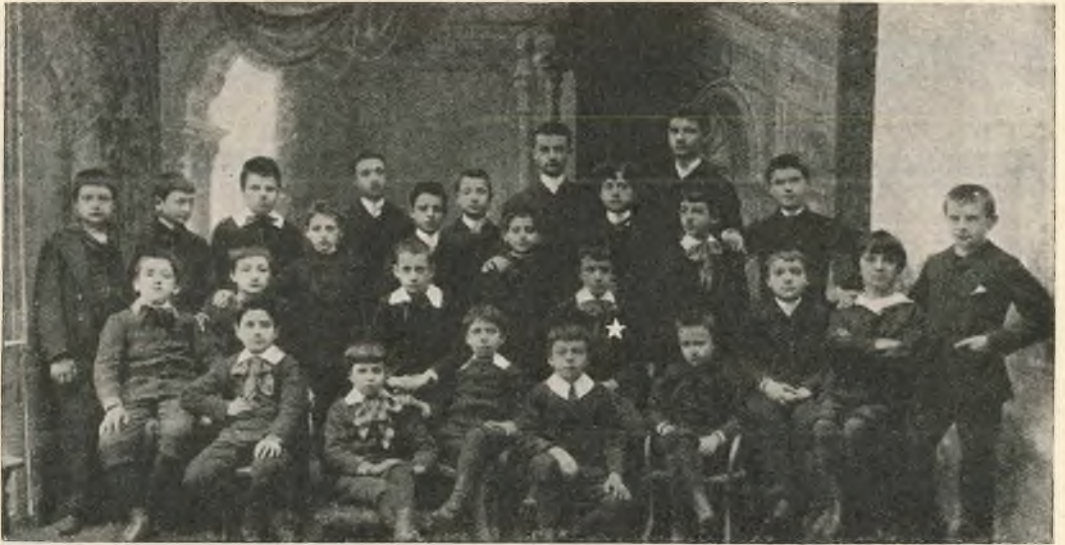
Pio XII (☆) undicenne, socio del circolo giovanile alla "Chiesa Nuova" in Roma.