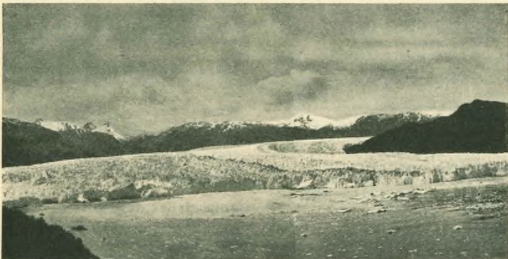
Ghiacciaio della Cordigliera Patagonica Meridionale denominato a Pio XI dal nostro esploratore Don Alberto De Agostini, in uno dei suoi ultimi viaggi di esplorazione, in omaggio al defunto Sommo Pontefice.