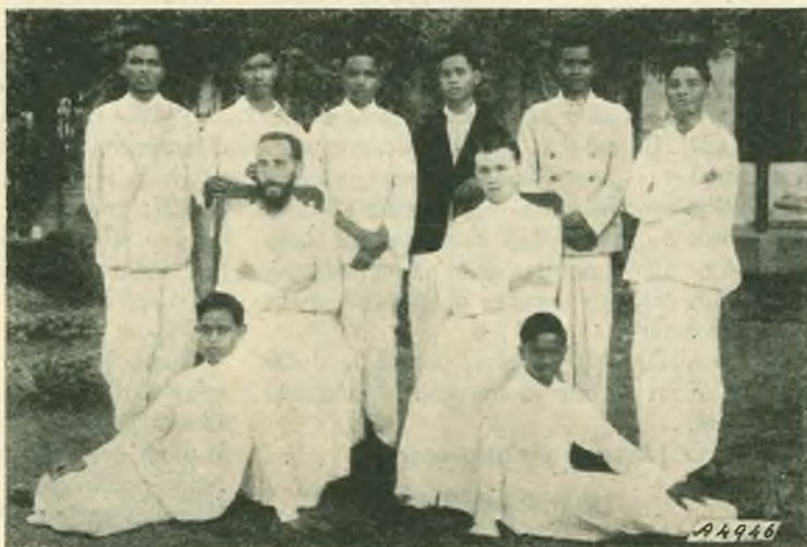
Assam. - Un gruppo di indigeni aspiranti alla Società Salesiana.

Dopo l'Ordinazione il popolo khasi festeggiò i novelli sacerdoti nel grande piazzale prospiciente il Santuario. Tutti passarono a baciare le mani consacrate ed a ricevere la loro prima benedizione mentre le note musicali e i fragorosi petardi riempivano l'aria di straordinaria