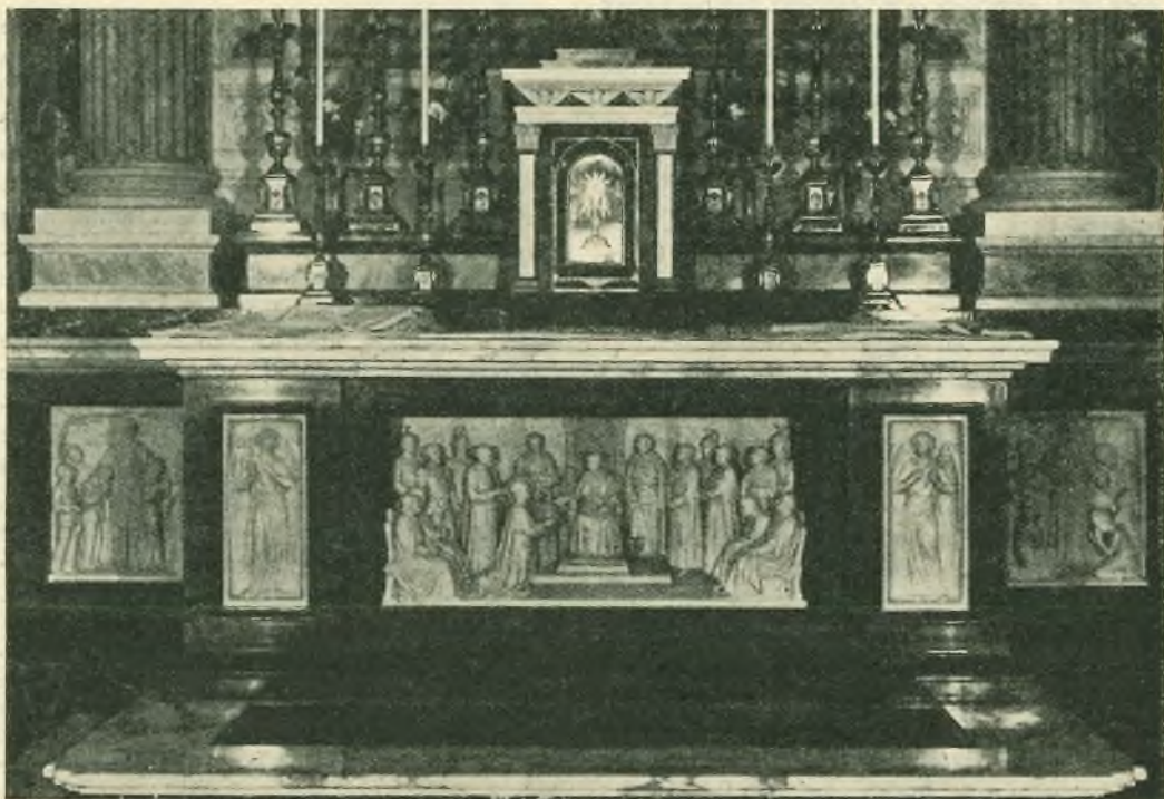
Roma. - Altare di S. Giovanni Bosco nella Basilica del Sacro Cuore. - I bassorilievi.