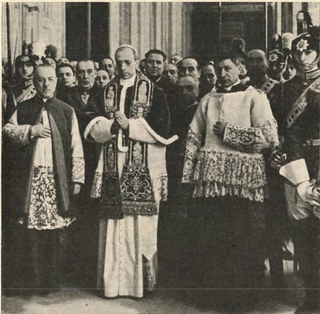
Sua Santità Pio XII, appena eletto, in procinto di recarsi ad impartire la prima benedizione a Roma e al mondo.

Nonostante la sua ripetuta aspirazione di dedicarsi al ministero sacerdotale per effondere nel contatto diretto con le anime i tesori della sua, la volontà dei superiori lo avviava alla vita diplomatica chiamandolo nel febbraio 1901 alla Sacra Congregazione degli Affari