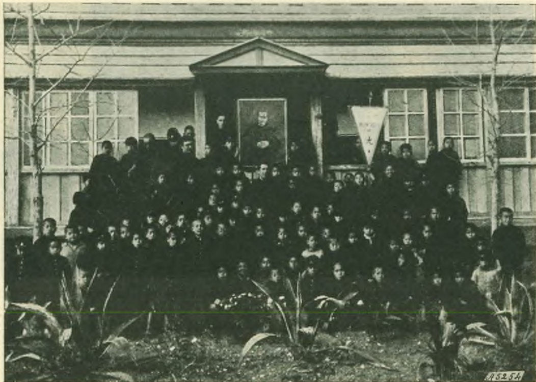
Miyazaki (Giappone). - L'Oratorio salesiano.

Pochi anni or sono, caso certo assai raro, se non vi si vuol vedere uno speciale intervento divino, guarì dal suo male, e dopo attenti esami, i medici del Lazzaretto la dichiararono sana. Avrebbe potuto lasciare quel luogo di sofferenza e godersi gli ultimi anni in ambiente migliore; invece l'eroica suora rimase al suo posto, e continuò infaticabile a prodigarsi in mezzo ai poveri lebbrosi, tra i quali le sarebbe stato tanto caro poter chiudere la sua vita. Il Signore, però, gliene chiese il sacrificio!