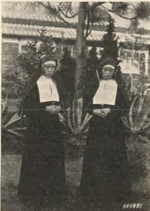
Giappone. - Le prime due suore indigene della nuova "Congregazione delle Suore di Carità".

per giungere al risultato che riempie il cuore di tutti di immensa gioia e di grandi speranze per l'avvenire. Lo stesso S. Padre Pio XI in varie circostanze e nel Congresso delle Conferenze tenuto in Roma nell'aprile del 1938 e nell'udienza accordata al sottoscritto nell'agosto dello stesso anno si era dimostrato assai soddisfatto e consolato di questo avvenimento, che fa prevedere l'utilità che renderà alla Chiesa lo sviluppo di questo speciale apostolato sorto dalle Conferenze di S. Vincenzo. Io domando preghiere, preghiere, preghiere, per questa nascente Istituzione.