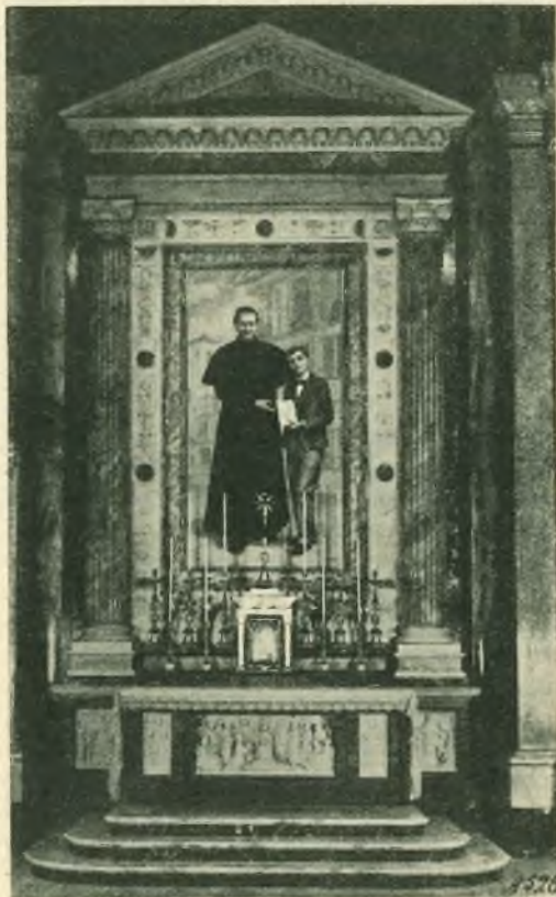
S. Giovanni Bosco e il ven. Domenico Savio. (Pala del Crida nell'altare di San Giovanni Bosco nella Basilica del Sacro Cuore in Roma).

Sorrisi di cielo allietarono l'animo dell'angelico giovane con rivelazioni ed estasi, che Don Bosco descrive e che testimoni degni di fede confermano. Il medesimo Don Bosco in un sogno del 1876, smagliante di bellezze spirituali e contenente ben quattro vaticini avverati, vide il suo discepolo nei fulgori della glo-