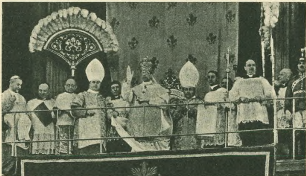
In tutta la maestà Pontificale, Pio XII, appena incoronato, imparte la sua benedizione al mondo intero.

Poco dopo, il medesimo Pontefice Pio X di santa memoria lo nominava Segretario della