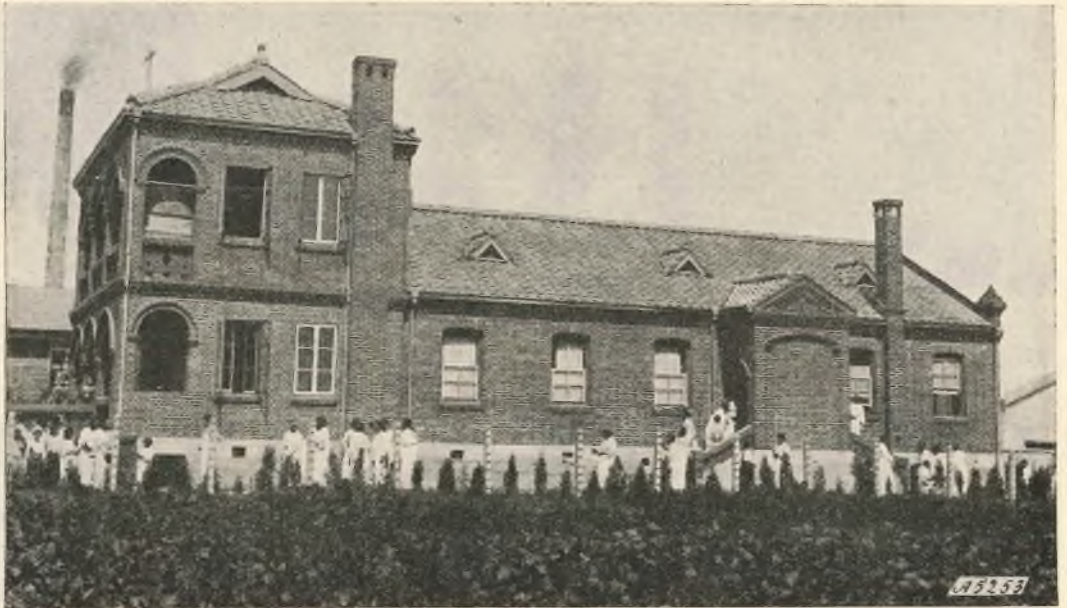
Corea - Eitôho. - Chiesa dedicata a San Giovanni Bosco.

dare alla santa Congregazione di Propaganda Fide il permesso per la fondazione. Ottenutolo nel giugno 1937, ed espletato quanto è di dovere per la formazione delle religiose, vennero coronati gli sforzi di quanti avevano lavorato