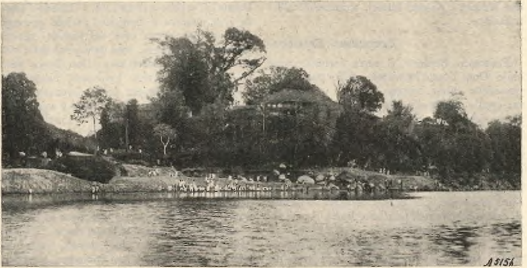
Tezpur. - La stazione missionaria.