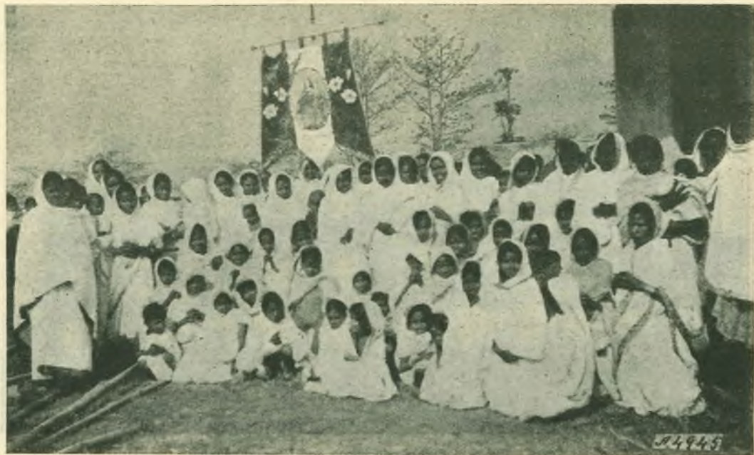
Assam. - Una nuova associazione di Azione Cattolica femminile.

Il Signore benedica lo zelante parroco ed i suoi coadiutori, che animati da vero spirito salesiano nell'organizzazione dell'Oratorio, dei Circoli giovanili e nell'insegnamento catechistico, gettano le basi di quella vita che formerà dei veri cristiani che faranno onore alla Chiesa ed alla Patria.