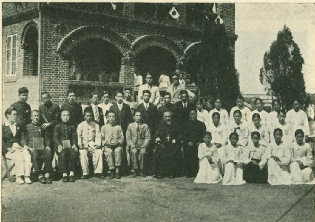
Corea - Eitôho. - I cantori attorno al Vescovo ed al Parroco dopo la benedizione della chiesa dedicata a San Giovanni Bosco.